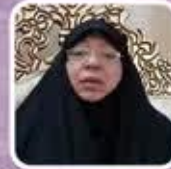
استاد ام فرقان عراق