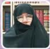
دکتر پروین جهانی ایران