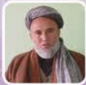
مولوی میر محمد نظری افغانستان