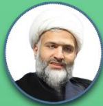
حجت الاسلام والمسلمین سعید صلح میرزایی نماینده مجلس خبرگان رهبری ایران

۱۵:۰۰ ساعت : ۱۴۰۲ اسفند ۲۷ یکشنبه live.Taqrib.ir