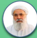
مولوی اسحاق مدنی رئیس شسورای عالی مجمع جهانی تقریب مذاهب اسلامی