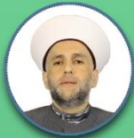
شیخ عبدالله جبری دبیر کل جنبش امة لبنان