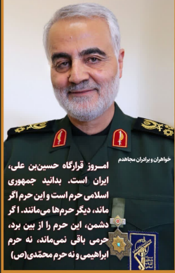
فرماندها و پادشاهان

امروز قارگاه حسین بن علی، ایران است. بدانید جمهوری اسلامی حرم است و این حرم اگر ماند، دیگر حرم‌ها می‌مانند. اگر دشمن، این حرم را از بین برد، حرمی باقی نمی‌ماند، نه حرم ابراهیمی و نه حرم محمّدی (ص)