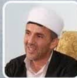
ماموستا عبدالسلام امامی ایران