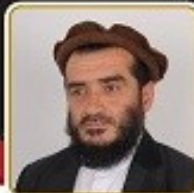
مولوي محمد مغني مطلق رئيس الحركة الاسلامية - افغانستان