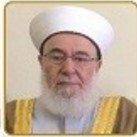
شيخ غازي حنينه (رئيس مجمع العلماء الشاهين ايراني)