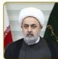
الدكتور امير حديد شهرزاري الامين العام للمجمع العالمي للتقريب بين المذاهب الاسلامية - ايران