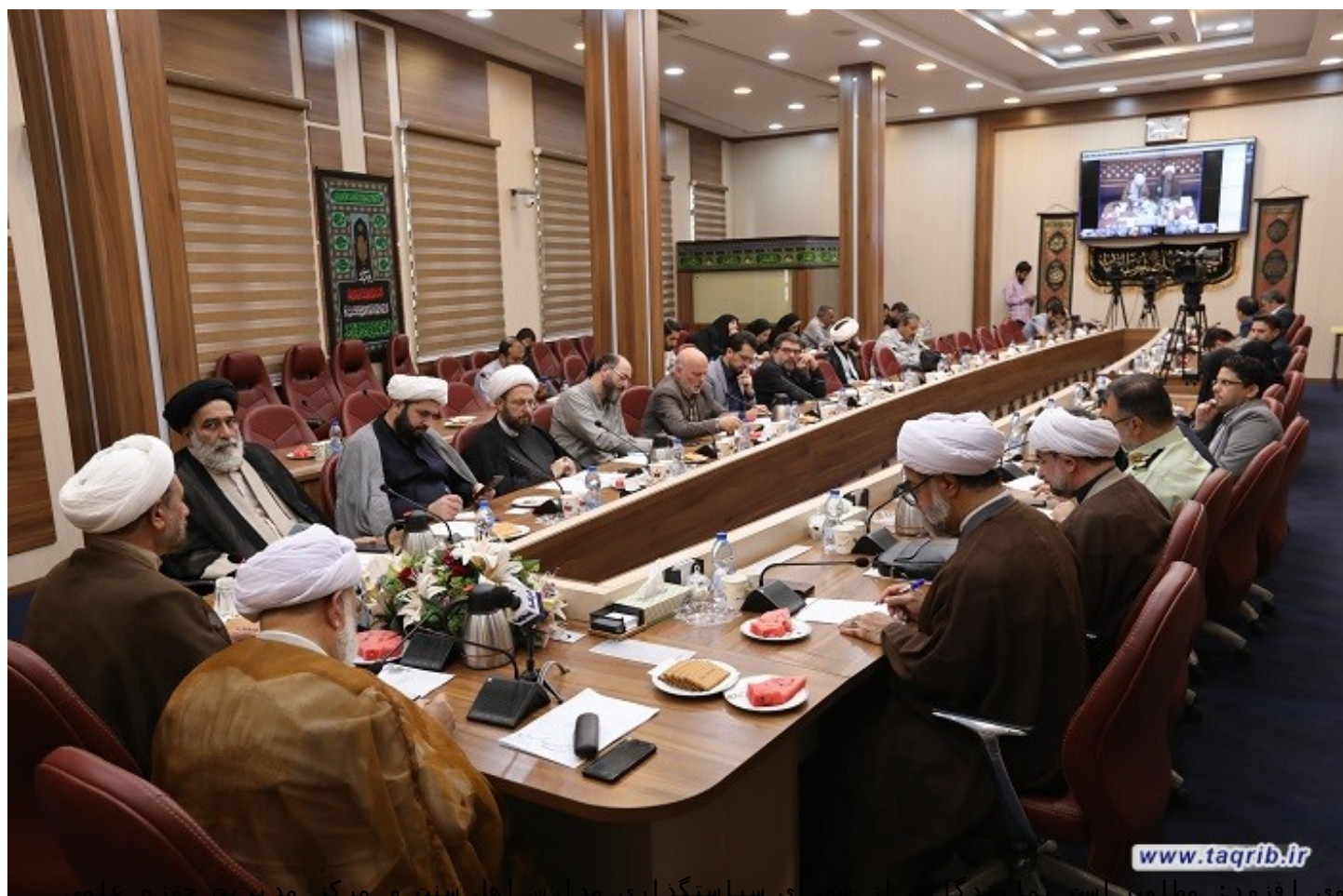
وی افزود: مطلوب است دستگاه‌ها با اختصاص اعتبار لازم محتوای ویژه‌ای را برای هفته وحدت تولید و در فضای مجازی منتشر نمایند.

حجت الاسلام والمسلمین مولایی، نماینده مجمع تقریب مذاهب اسلامی، با تأکید بر اینکه، ادبیات و گفتمان، در عرصه بین‌المللی، قطعاً با داخل کشور تفاوت‌هایی دارد، افزود: پیشنهاد می‌شود، کمیته بین‌الملل برنامه‌های هفته وحدت، با حضور نمایندگان دستگاه‌هایی از جمله مجمع اهل‌بیت، مجمع تقریب مذاهب، سازمان فرهنگ و ارتباطات اسلامی، وزارت خارجه و سایر دستگاه‌های ذیربط، تشکیل و راه‌اندازی شود، تا با همکاری و همفکری آنان برنامه‌های بین‌المللی به نحو شایسته برنامه‌ریزی گردد.