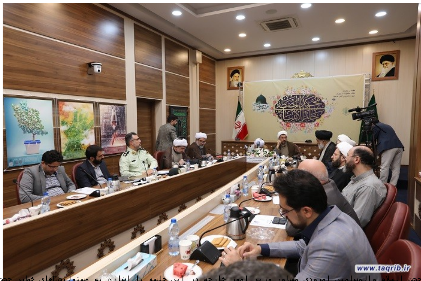
حجت الاسلام والمسلمین امروزی مشاور وزیر امور خارجه در این جلسه با اشاره به مسئولیت‌های خطیر حجت

وی در پایان با اشاره به اینکه، دشمن برای ایجاد گسست و کاهش سرمایه اجتماعی در کشور برنامه‌ریزی کرده است گفت: با توجه به انتخابات پیش‌رو و ضرورت حفظ نشاط، امید و همبستگی اجتماعی، لازم است در فرصت فرخنده ایام هفته وحدت، برای تحقق اهداف کانونی ذکر شده، تلاش بیش از پیش داشته باشیم.