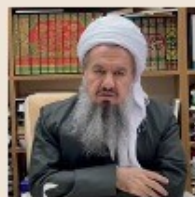
شیخ میرزا علی اکبر رشیدی رئیس هیئت مدیران و مدیر عامل بنیاد القدس