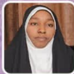
استاد فاطمه ثانی نیجریه