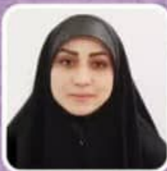
استاد انفال الحلو عراق