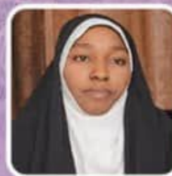
استاد فاطمه ثانی نیجریه