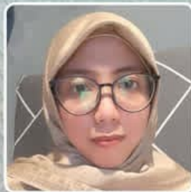
وا اوده زینب زیلوالله توریسانی اندونزی