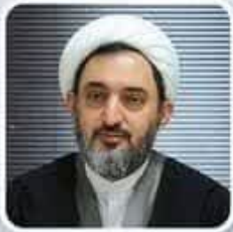
حجت الاسلام والمسلمین دکتر حاج ابوالقاسم دولابی ایران