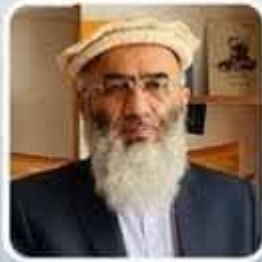
مولوی حبیب الله حسام افغانستان