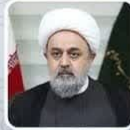
حجت الاسلام والمسلمین دکتر شهراری ایران