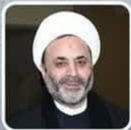
شیخ فواد خریس لبنان